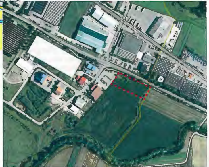
Luftbild (2011, erg.)