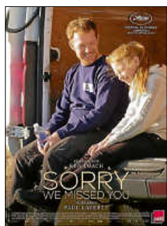
Sorry we missed you