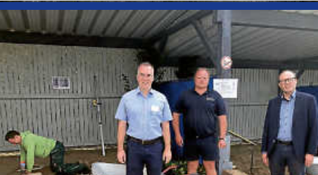
Die Garten- und Landschaftsgärtner legen Prüfungen in Donaueschingen ab.