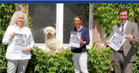
Jetzt anmelden: Das Sommerferienprogramm 2020 steht in den Startlöchern.