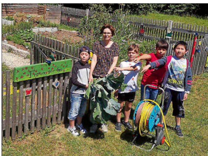
Schulgarten der Erich-Kästner-Schule