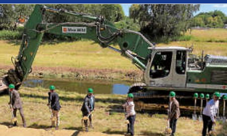
Der Donauursprung wird naturnah und erlebbar.