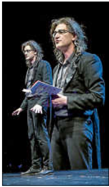
Anders gedeutsch- Foto: Nikolaus Pfusterschmidt

Gliedmaßen in Rage, so tobt er mit Worten, grotesk und wild, als habe ihn die Muse einmal zu viel geküsst. Marcus Jeroch deutsch anders.