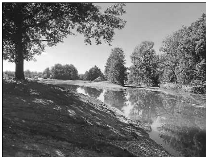
Neu gestalteter Flusslauf der jungen Donau

Das Projekt des am RP angesiedelten Landesbetriebs Gewässer am Zusammenfluss von Brigach und Breg ist eine der größten Renaturierungsmaßnahmen in Baden-Württemberg. Der Donauursprung wird naturnah gestaltet und für Besucherinnen und Besucher erlebbar gemacht. Im Zuge des Projekts wird die Donau um 300 Meter verlängert. Das Vorhaben kostet rund vier Millionen Euro.