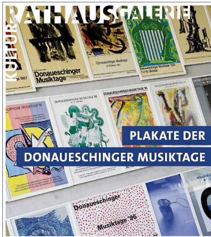
Plakatausstellung Musiktage 2020