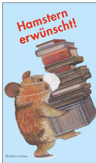
Hamstern erwünscht