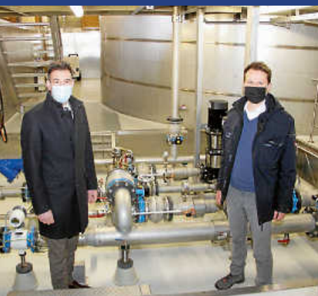
Donaueschinger Wasserqualität ist weiterhin sehr gut.

filmfreund BaWü Das Filmportal der Bibliotheken