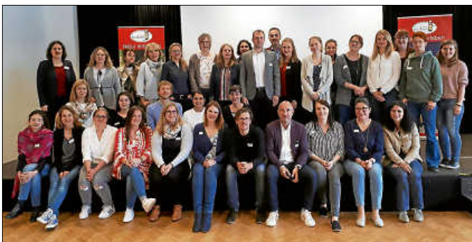
Foto: Die Teilnehmerinnen und Teilnehmer des STG-Workshops in der Bräunlinger Stadthalle

Im Rahmen seiner Informationsreisen war das Team der Schwarzwald Tourismus GmbH (STG) am 16. Mai 2019 zu Gast in Bräunlingen, um sich mit den Mitarbeiterinnen und Mitarbeitern der Tourist-Infos in der Quellregion Donau, im südlichen Schwarzwald-Baar-Kreis und der Wirtschafts- und Tourismusförderung im Landratsamt auszutauschen. Zu Beginn stellten die einzelnen Kommunen (Donaueschingen, Hüfingen, Bräunlingen, Blumberg und Bad Dürkheim) und der Schwarzwald-Baar-Kreis ihre touristischen Attraktionen und Veranstaltungs-Highlights vor. Nach sogenannten „Speed-dates“, in denen sich die Touristiker über künftige Projekte und die bislang schon gute Zusammenarbeit unterhielten, folgte der Besuch der römischen Badruine in Hüfingen mit spannender Erlebnisführung. Zum Abschluss wurde noch die Donauquelle in Donaueschingen besichtigt.