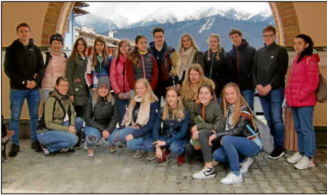
Die Donaueschinger Gymnasten haben in einem Rostover Kindergarten mit Kleinkindern gemeinsam gebastelt.