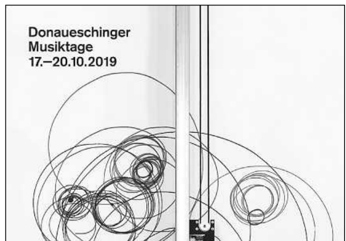
Plakat Donaueschinger Musiktage 2019 - Künstlerin: Angela Bulloch

Die Ausstellung ist während der Service-Zeiten des Rathauses zugänglich.