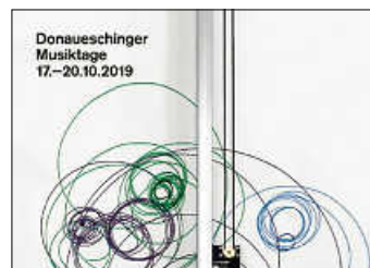
Plakat Donaueschinger Musiktage 2019 - Künstlerin: Angela Bulloch

Auch zu den diesjährigen Musiktage findet wieder eine Ausstellung mit Musiktageplakaten im Rathaus I statt. Gezeigt werden aktuelle Plakate der letzten Jahre und eine bunte Auswahl von Musiktageplakaten der vergangenen Jahre.