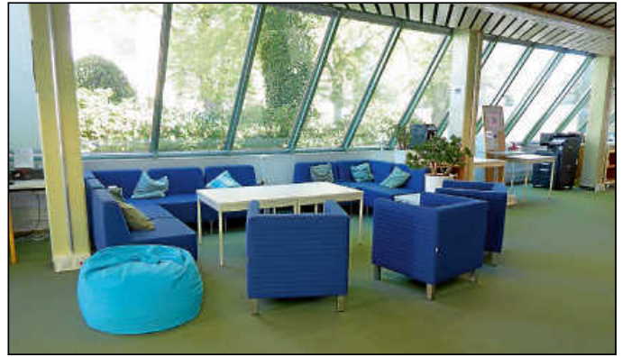
Die neuen Sitzmöbel in der Stadtbibliothek laden zum Verweilen ein.

Zudem berät Herr Kemter in allen anderen Fragen die im Zusammenhang mit einer Behinderung stehen. Terminvereinbarungen sind per Telefon 0771 17 51 22 07 oder E-Mail unter Behindertenbeauftragter@donaueschingen.de möglich.