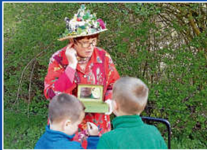
Am Sonntag, 13. Oktober 2019, wird um 15:00 Uhr die Erlebnisführung „Märchenhafter Schlosspark“ für Groß und Klein angeboten.