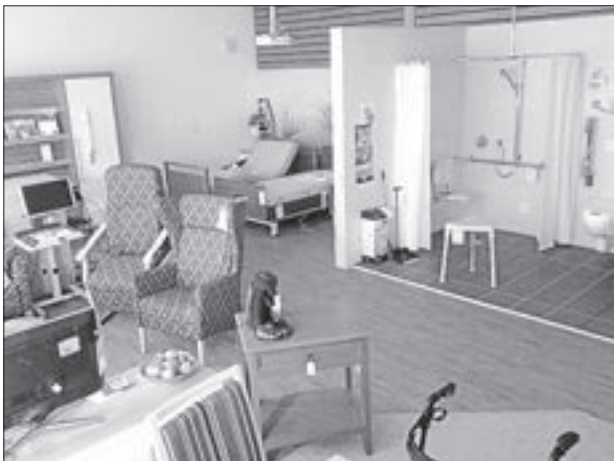
Die Führungen finden statt in der Gewerbeschule VS-Schwenningen, Erzberger Straße 28

Hier können sich Interessierte über Barrierefreiheit, Hilfsmittel und technische Neuerungen informieren und diese ausprobieren.