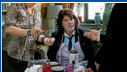
Das Kommunale Kino guckloch zeigt am Montag, 24.10.2016, den Film „Toni Erdmann“.