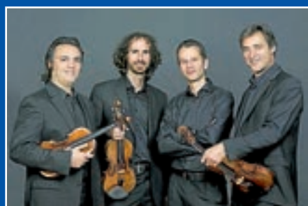
Am Samstag, 12.11.2016, erwartet die Gesellschaft der Musikfreunde in ihrer Konzertreihe das Klenze Quartett aus München.